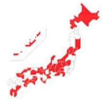
SFTSウイルスを保有した マダニの生息地域（2016年3月時点）

【全国で319名の感染届出、うち60名死亡（死亡率18%）】 犬がSFTSウイルスを持ったマダニを生活環境に持ち込み、人がマダニに咬まれてSFTSに感染する可能性があるため、犬のマダニ予防は大切です。