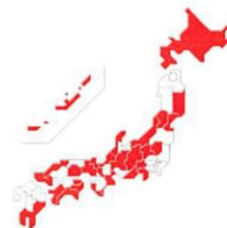
SFTSウイルスを保有したマダニの生息地域（2016年3月時点）

またワンちゃん、猫ちゃんがSFTSウイルスを持ったマダニを生活環境に持ち込み、人がマダニに咬まれてSFTSに感染する可能性があるため、マダニ予防は必須なのです。